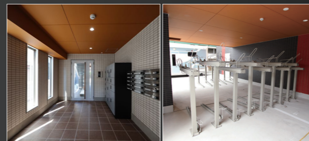
エントランスオートロック / 防犯カメラ 屋内駐輪場